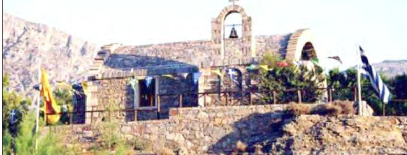
Ναός Αγίου Φανουρίου στο Καβούσι Ιεράπετρας

Στην Κρήτη λόγω και της στενής σχέσης με την αρκετά κοντινή Ρόδο, ο Άγιος Φανούριος είναι πολύ αγαπητός και οι γυναίκες συνηθίζουν ακόμα να κατασκευάζουν την περίφημη "Φανουρόπιτα" για να την μοιράσουν στην εκκλησία που φέρει το όνομα του κυρίως. Η διάδοση του Αγίου στην Κρήτη συνδέεται με το γνωστό θαύμα του, με την διάσωση των Κρητικών ιερέων από την θαλασσοταραχή κατά την επιστροφή τους στην Κρήτη από την Ρόδο.