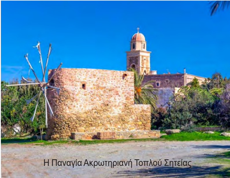
Η Παναγία Ακρωτηριανή Τοπλού Σητείας

Ο Αύγουστος είναι ο μήνας, που σε κάθε μέρος της Ελλάδας, από τα μεγάλα αστικά κέντρα έως την πιο ακριτική γωνιά, τιμάται το πρόσωπο της Παναγίας μας.