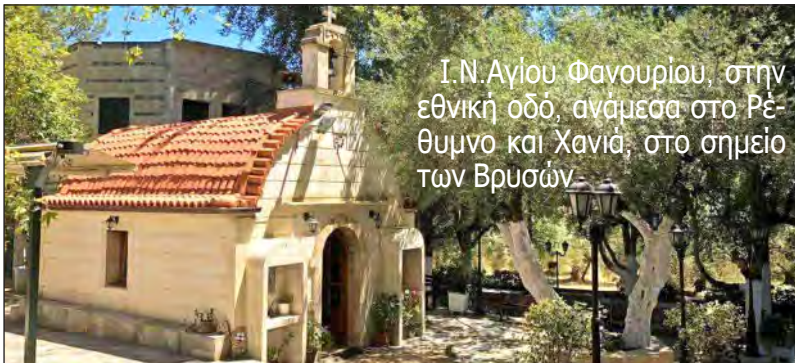
Ι.Ν. Αγίου Φανουρίου, στην εθνική οδό, ανάμεσα στο Ρέθυμνο και Χανιά, στο σημείο των Βρυσών.

Γύρω από την εικόνα του Αγίου, υπήρχαν 12 παραστάσεις στις οποίες απεικονιζόταν το μαρτύριο του. Έτσι το μόνο που γνωρίζουμε είναι πως πρόκειται για έναν μάρτυρα ο οποίος πιθανότατα υπήρξε στρατιώτης. Το όνομα Φανούριος του αποδόθηκε από τον Μητροπολίτη Ρόδου Νείλο, ο οποίος ανακαίνισε το εκκλησάκι που βρέθηκε η εικόνα, αφιερώνοντας το στον νεοφανή Άγιο Φανούριο.